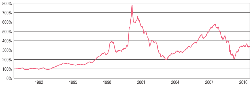
Fondsbeginn: 16.10.1989, mit Wiederveranlagung der Ausschüttung (entspricht der Berechnung der OeKB) Errechneter Wert per 13.10.1989 von EUR 70,56 entspricht 100%